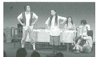
2006最優秀劇団 イスパニア語劇団の舞台 La doma del alba(暁に訪れる女)

●神戸外大生のユニークな伝統行事—語劇祭 語劇祭とは、各学科毎の5つの劇団がそれぞれの専攻している言語で劇をし、競い合う、本学の伝統行事です。内容は各国の既成の台本等によりコメディ、サスペンスと多岐にわたり、一般の方にも楽しんでいただけます。是非一度観劇にお越しください。(今年は12/15・16神戸アートビレッジセンターで上演<日本語字幕有>) 語劇祭ホームページ http://www.geocities.jp/gogeki06/