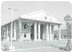
兵庫県立大学 (神戸学園都市キャンパス)