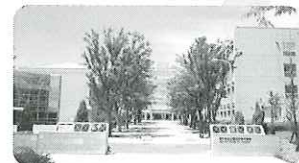
神戸市立工業高等専門学校

神戸芸術工科大学 神戸市外国語大学 兵庫県立大学(神戸学園都市キャンパス) 兵庫県立大学(明石キャンパス)