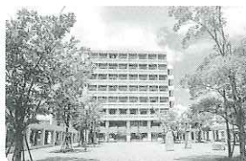
神戸市外国語大学