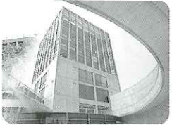
兵庫県立大学 (明石キャンパス)