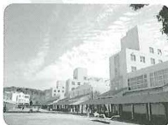
神戸芸術工科大学